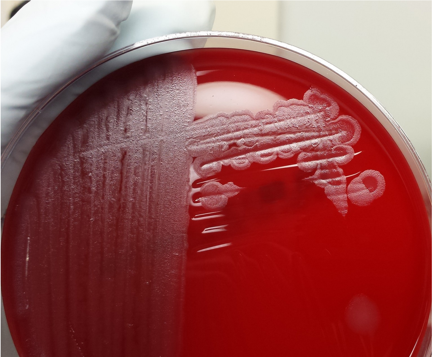
Milzbranderreger Bacillus anthracis auf einer Agarplatte: Phagen haben die Bakterien im Inneren der Kolonie lysiert.

Länder Phagenpräparate zum Schutz vor bakteriellen Kontaminationen in Lebensmitteln ein. Künftig könnten Phagen auch in der Massentierhaltung Antibiotika ersetzen.