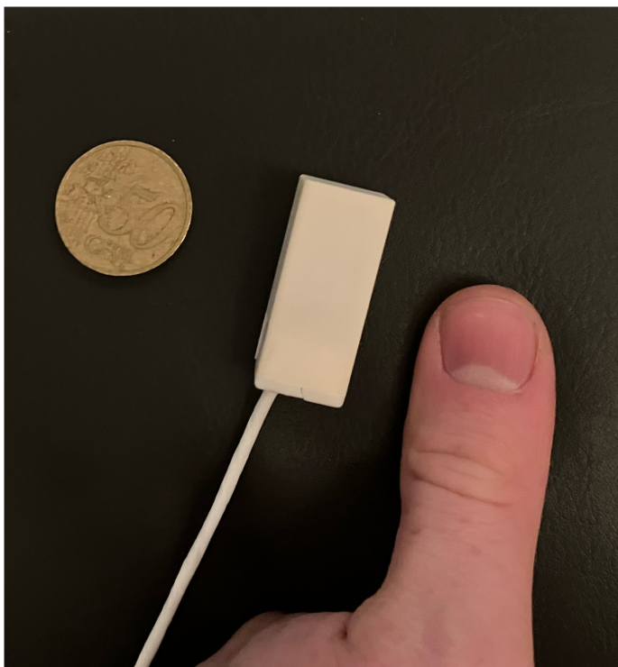
Der Quantensensor ermöglicht durch seine extrem kompakte Bauweise eine flexible Position am Muskel.

Kontaktlose, präzise Einblicke in die neuromuskuläre Gesundheit bieten besonders in der Pädiatrie großes Potenzial. Da die Messung berührungs- und schmerzlos erfolgt, wird sie von Kindern gut akzeptiert. So lassen sich neuromuskuläre Veränderungen frühzeitig erkennen und gezielt behandeln.