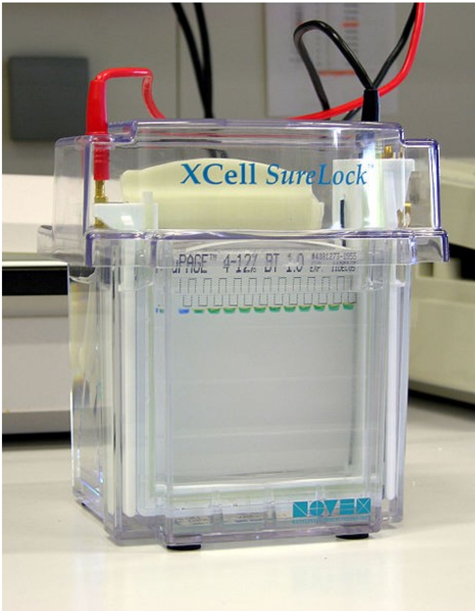
Moderne Gelelektrophoreseapparatur in vertikalem Tanksystem.