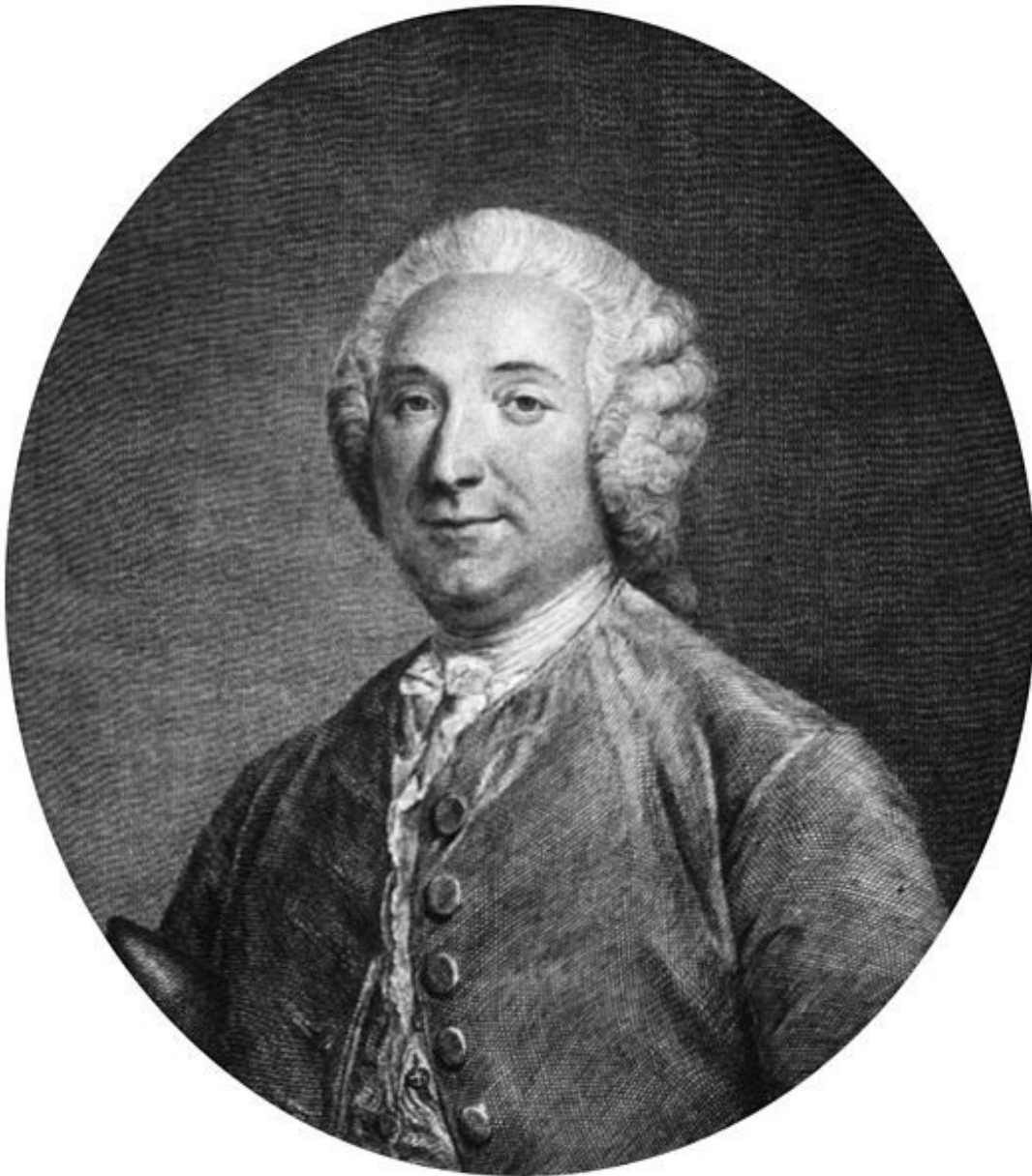
Pierre J. Macquer, französischer Arzt und Chemiker: Sein Interesse galt der Anwendung chemischer Erkenntnisse in der Medizin.

Nur durch die Kenntnis der Analysemethoden lässt sich einschätzen, ob und inwieweit eine Theorie Gültigkeit hat. Inzwischen hat die Analytik nicht mehr nur die Aufgabe als Hilfswissenschaft, die Daten aus anderen Disziplinen zu bestätigen, sondern ist zum eigenen Fachgebiet avanciert, das in der Lage ist, aus sich heraus Fragen zu formulieren und zu beantworten. Als selbstständige Wissenschaft liefert sie mit methodischen Entwicklungen die Grundlage für die Erforschung biologischer Zusammenhänge und hat somit wohl auch die wirklich signifikanten Fortschritte in der Forschung angetrieben.