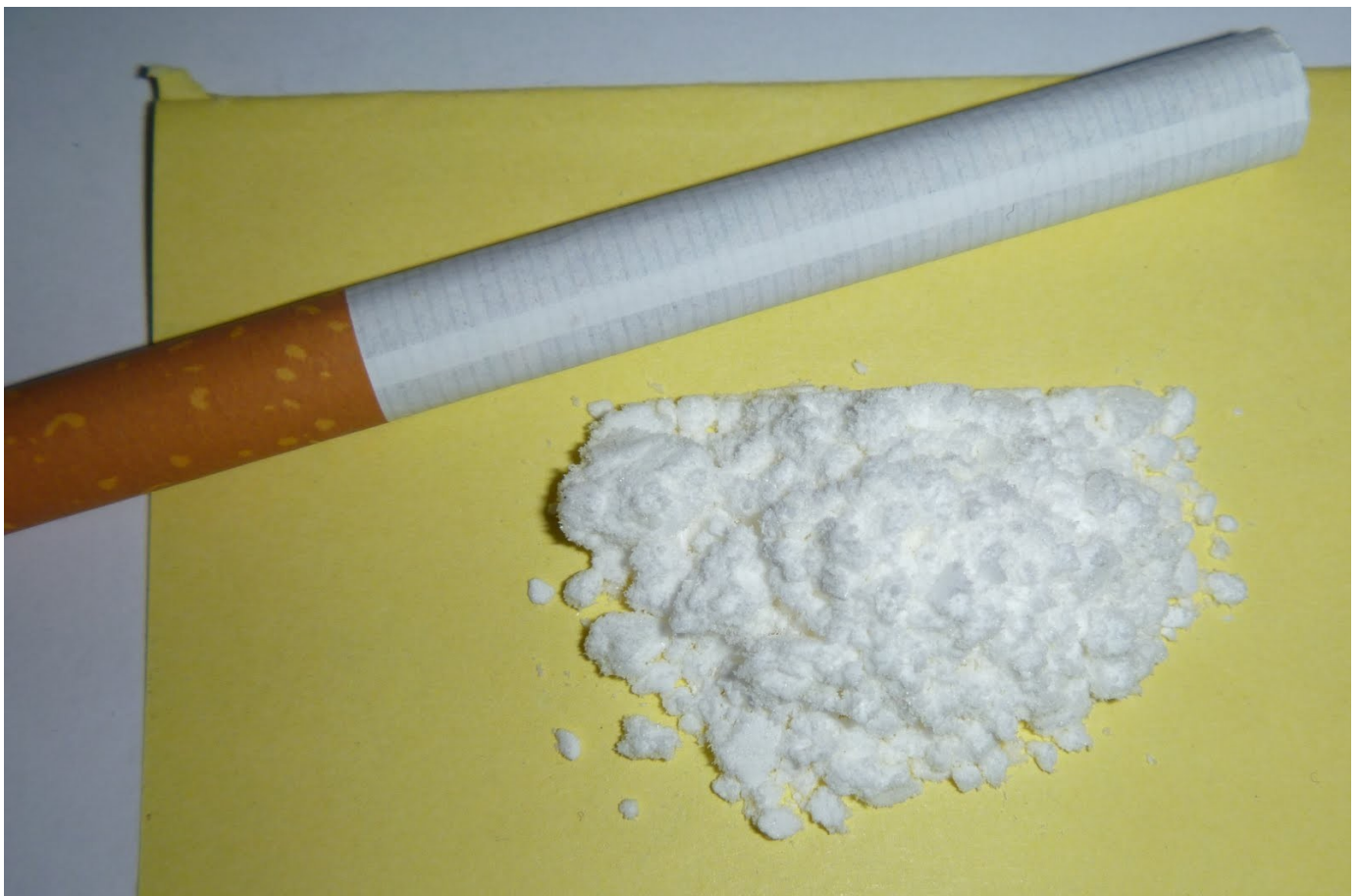
Kokain und Zigarette.

Es gibt eine enorme Vielfalt unterschiedlicher Stoffe und Verhaltensweisen, die süchtig machen. Ständig kommen neue hinzu. Die häufigsten und bekanntesten sind: Alkohol, Tabak, Heroin und andere Opioide, Cannabis, Kokain, natürliche oder synthetische Halluzinogene (z. B. Mescaline bzw. LSD), Aufputschmittel (v. a. Amphetamine wie z. B. Ecstasy oder MDMA, aber auch Ephedrin),