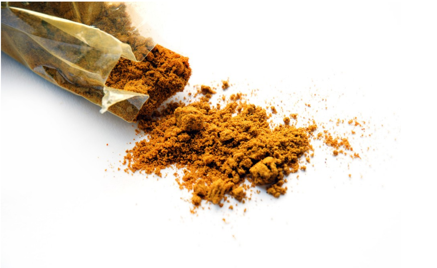
Kurkuma / Curry