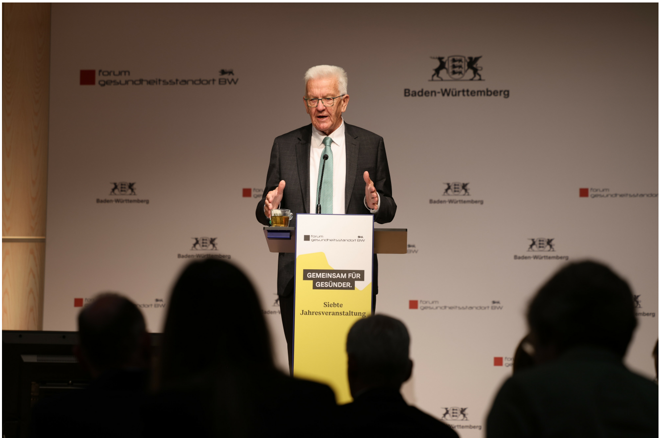
Ministerpräsident Winfried Kretschmann bei seiner Rede zur 7. Jahresveranstaltung des Forums Gesundheitsstandort BW

In seiner Eröffnungsrede thematisierte Ministerpräsident Kretschmann auch die wichtigen Fortschritte, die im Forum Gesundheitsstandort in den vergangenen Jahren erreicht wurden: „Wir haben seit dem Bestehen des Forums viel erreicht. Beispielsweise, wenn es um die digitale Versorgung geht. Eine Video-Sprechstunde ist längst keine Besonderheit mehr. Auch die Zentren für Personalisierte Medizin, die Therapien maßschneidern, gehören mittlerweile fest zur medizinischen Versorgung der Spitzenklasse. Aktuell arbeiten wir an verbesserten Möglichkeiten für die Gesundheitsdatennutzung, um an innovativer Medizin von morgen zu forschen und vorne dabei zu sein. Dieser Vorstoß in der Regulatorik kann auch als Blaupause für das Bundesrecht dienen. Auch auf europäischer Ebene haben wir durch das Forum viele Verbesserungen erreicht, beispielsweise im Bereich der Medizinprodukte.“